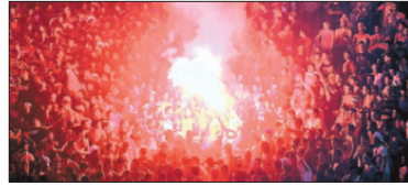
Tunesia: Esperance Sportive-fans tenner fakler under fotballkampen mot Etoile Sportive du Sahel på Rades stadion.